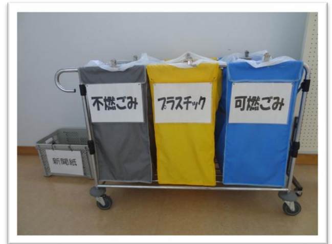
校舎内ゴミ回収時の分別の徹底