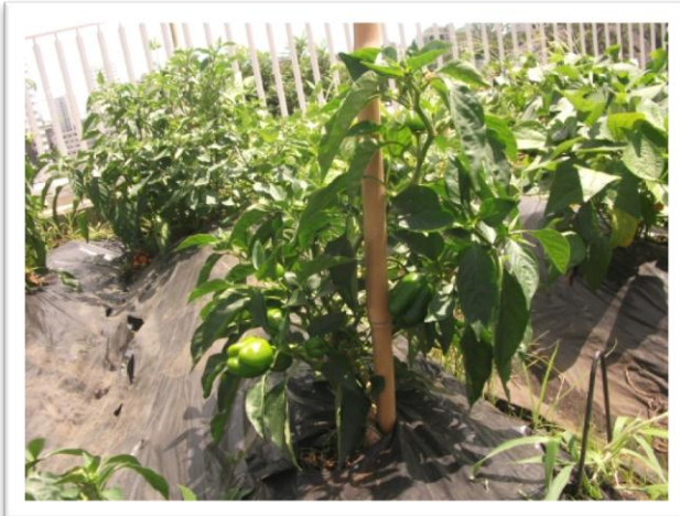
屋上での野菜の栽培