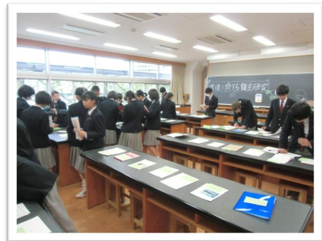
学芸発表時におけるレポート展示, 鑑賞