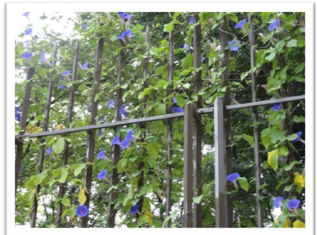
本校正門のところにある宇宙アサガオ