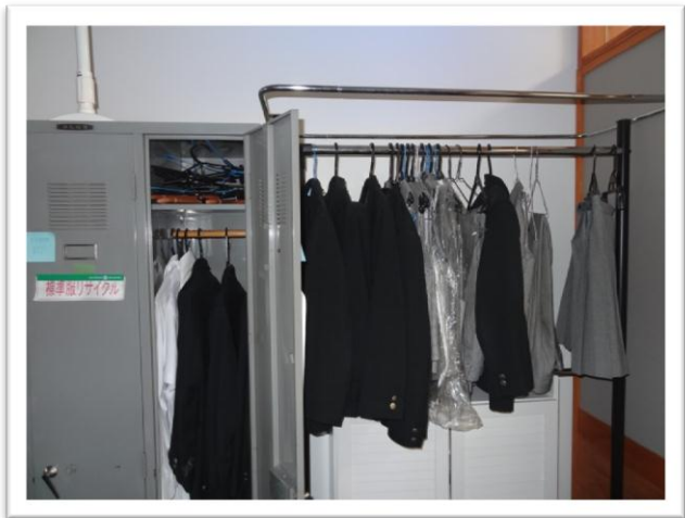
PTA によるリユース用標準服の保管