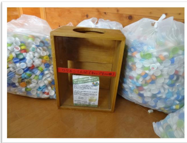
ペットボトルキャップの回収