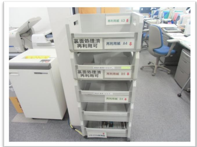
裏紙印刷用紙の分別回収と利用