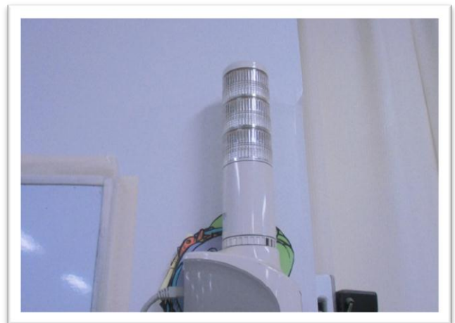
学校内の電気使用量がわかる表示