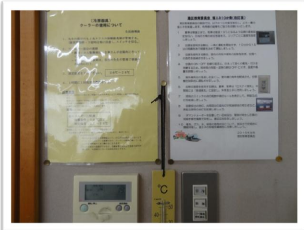
節電のための教室表示と室温表示用の寒暖計