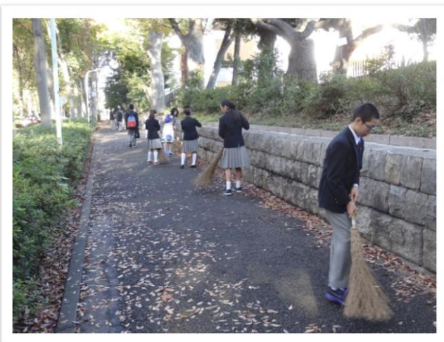
全校生徒当番制の落ち葉掃き