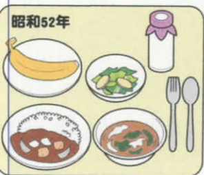
昭和52年 カレーライス・スープ・ サラダ・果物・牛乳