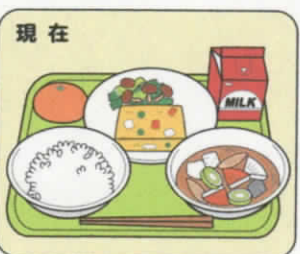
現在 ご飯・味噌汁・卵焼き・ 和え物・果物・牛乳