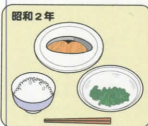
昭和2年 ご飯・焼き魚・漬物