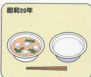
昭和20年 味噌汁・脱脂粉乳