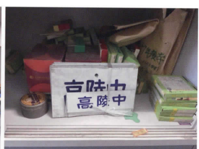
鉄道旅行で使われていたと思われるサボも丁寧に補管されていました。