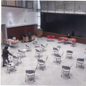
慶応義塾大学でのワークショップ、会場でのセッティング中の様子