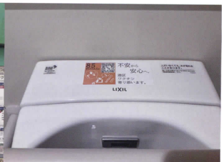
港区のワクチン接種に関連した掲示物、いきいきプラザのトイレに貼られたシール