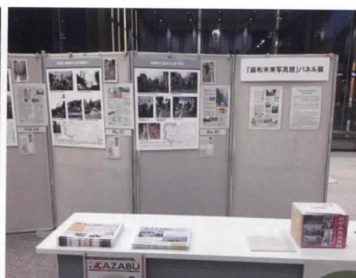
港区役所ロビーで行われたパネル展の様子。設置された報告書がすぐに無くなり、何度も追加頂きました。