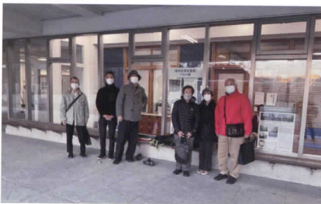
こちらのメンバー有志と、高陵中学校に伺い、貴重な写真資料のデジタル化をさせていただきました。