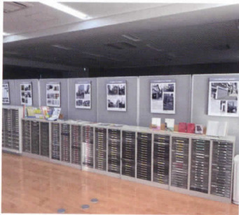
高陵中学校、図書館での写真パネル展示の様子