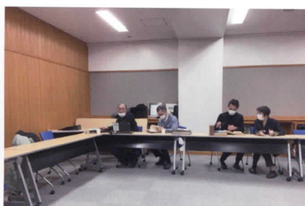
高陵中学校にて、写真のデジタル化を実施中の様子