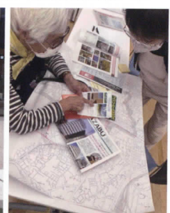
いきいきプラザでの、交流のひとつ