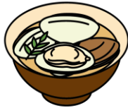
はまぐりのお吸い物

3月3日は「ひな祭り」。女の子の健やかな成長を願ってお祝いをする日本の伝統行事です。現在のように、ひな人形を飾るようになったのは江戸時代のことで、もとは人形を身代わりにして邪気をはらう「流しひな」が起源とされます。行事食として、ちらしずし、はまぐりのお吸い物、ひしもち、ひなあられなど、華やかな食べ物が並びます。